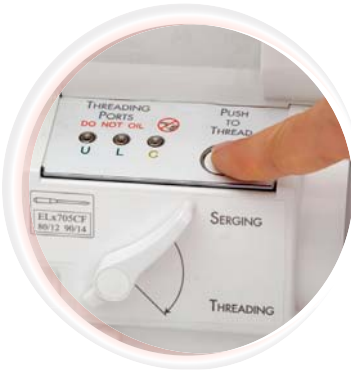
ExtraordinAir™ Threading System in 2009 door baby lock ontwikkeld