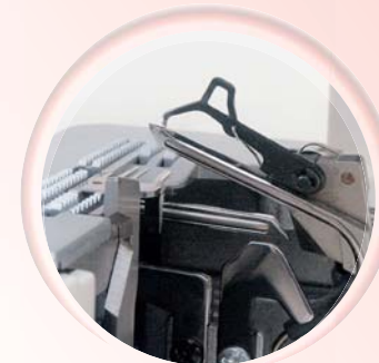
Stevige grijperkanalen met inklapbare hulpgrijper