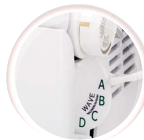
Selectie van de naad