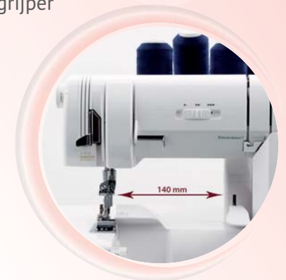
Snelheidsregeling en extra brede doorlaat