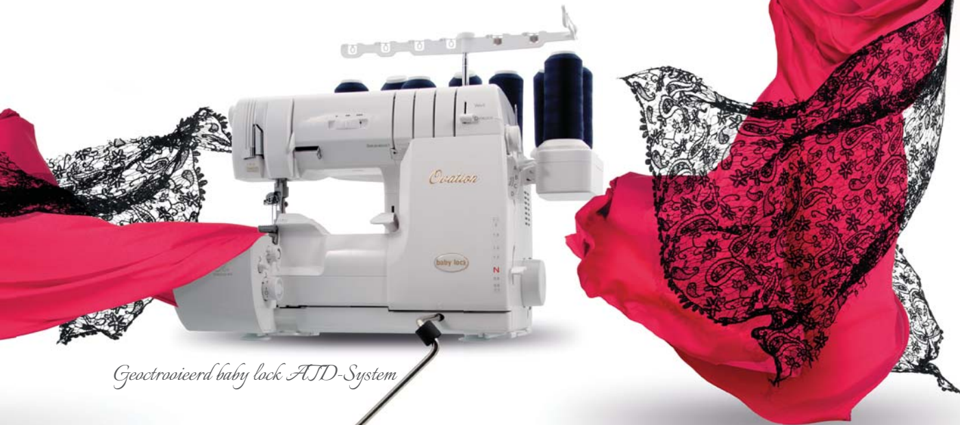
Geëlectrovoerd baby lock ATD-System

Optimaal naairesultaat met allerlei stoffen